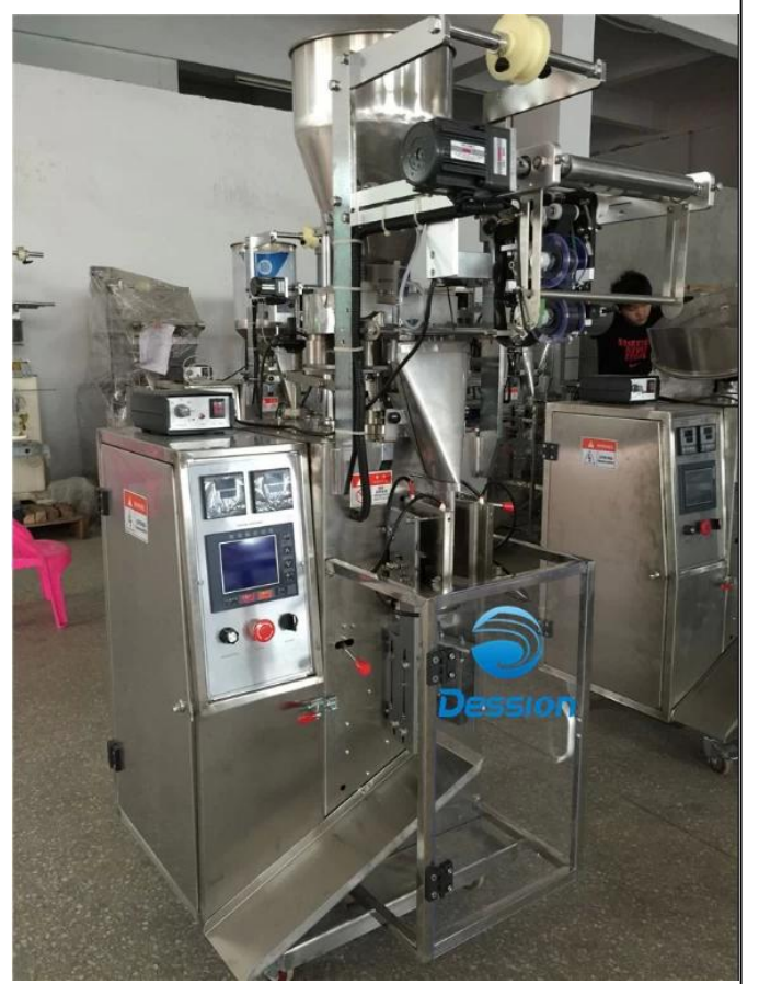
الجانب الأيسر من الماكينة