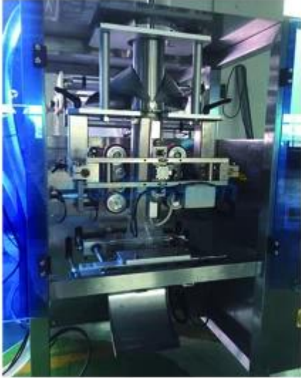
PART OF MIAN MACHINE