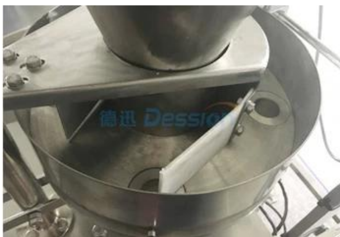
کوب میت ایرینگ