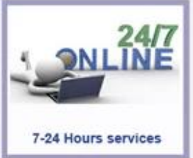
7-24 Hours services