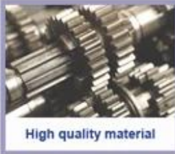
High quality material