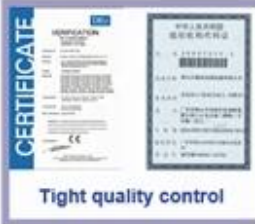
Tight quality control