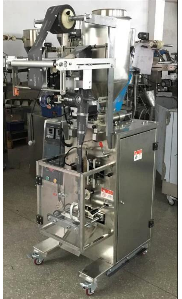
الجانب الأيمن من الماكينة