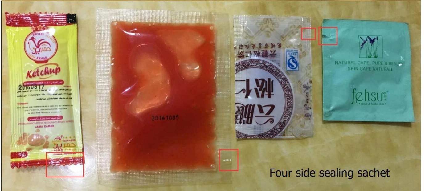
Four side sealing sachet