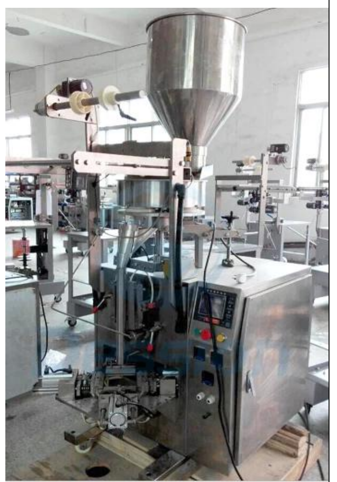
الجانب الأيسر من الماكينة

Dession آلة تغليف الأكياس المثلية الأوتوماتيكية