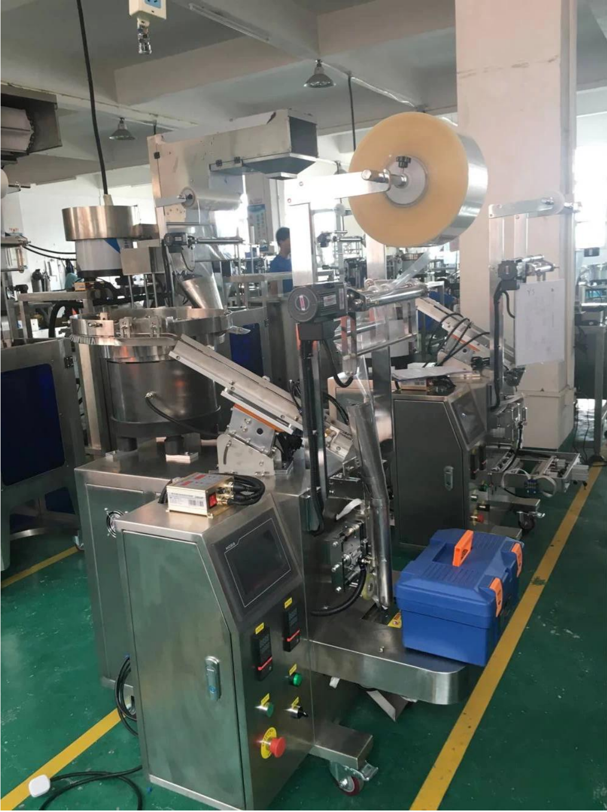
تظهر تفاصيل الجهاز: