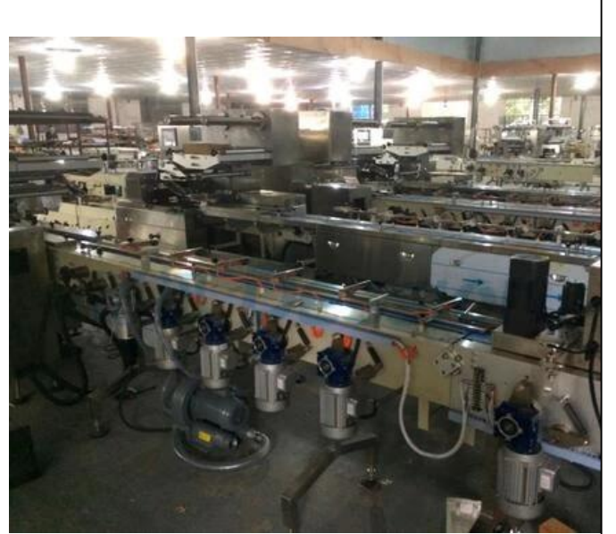
المنطقة المحلية للجهاز