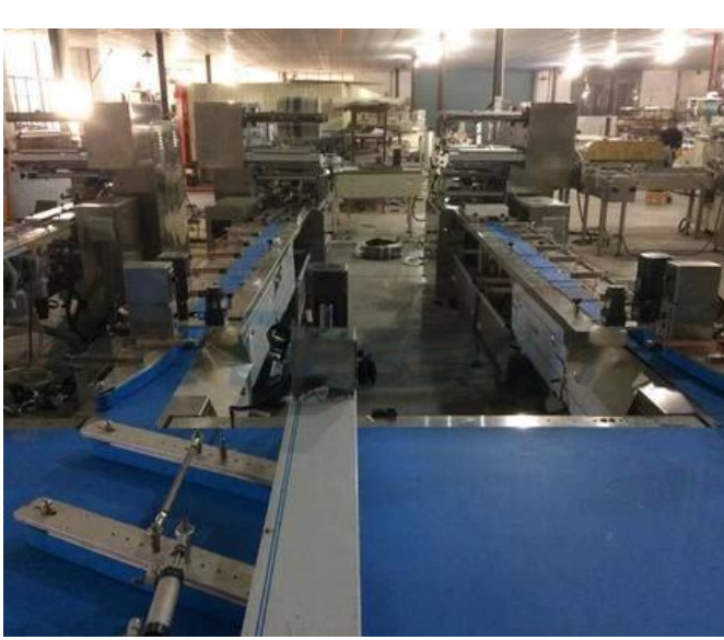
المنطقة المحلية للجهاز