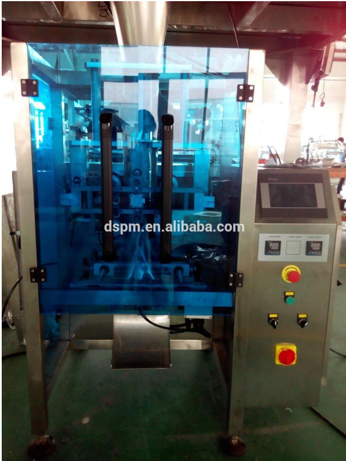
3. منصة الدعم