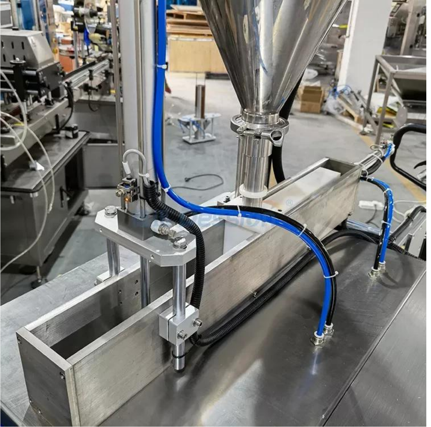
ملء المضخة الهوائية