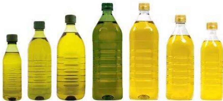
250 ml 500 ml 750ml 1L 1L 750ml 500 ml

Which is optional, and achieve to feed bottle and collect bottle automatically.