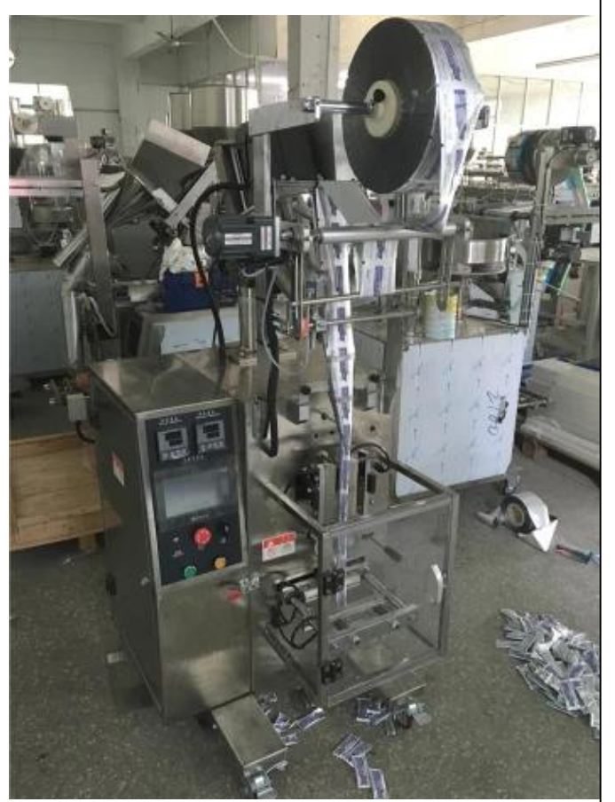
الجانب الأيسر من الماكينة