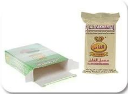
Bag Into Box