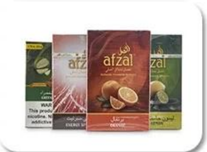
Cellophane & Tear Line Wrap