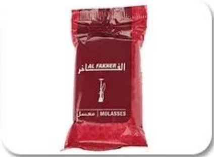
Plastic Bag Packing