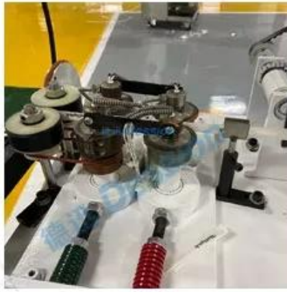
Bag sealing device