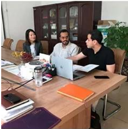
Collect Customer Needs

فريق محترف لتزويد العملاء بحلول التعبئة والتغليف المختلفة Dession لدى من خلال الفهم الكامل لاحتياجات العملاء، يقوم المهندسون بتصميم الحل الأنسب. لدينا ورشة المعالجة والتجميع الخاصة بنا وعملية فحص الجودة وتصحيح الأخطاء لضمان جودة الماكينة بعد قبولها من قبل العميل، يتم تعبئتها في علب خشبية ذات معايير دولية وشحنها إذا كان لدى العملاء أي أسئلة أثناء استخدام الجهاز، فسوف نقوم بالرد عليها في الوقت المناسب.