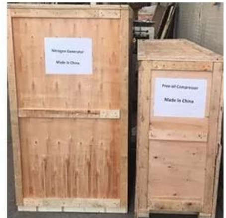
Wooden Box Packing