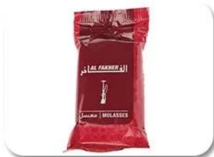
Plastic Bag Packing