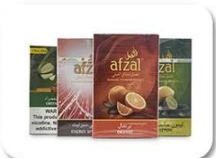
Cellophane & Tear Line Wrap