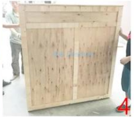
德迅 德迅 德迅 德迅 Maraqeta