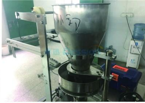
POWDER PUT IN EQUIPMENT