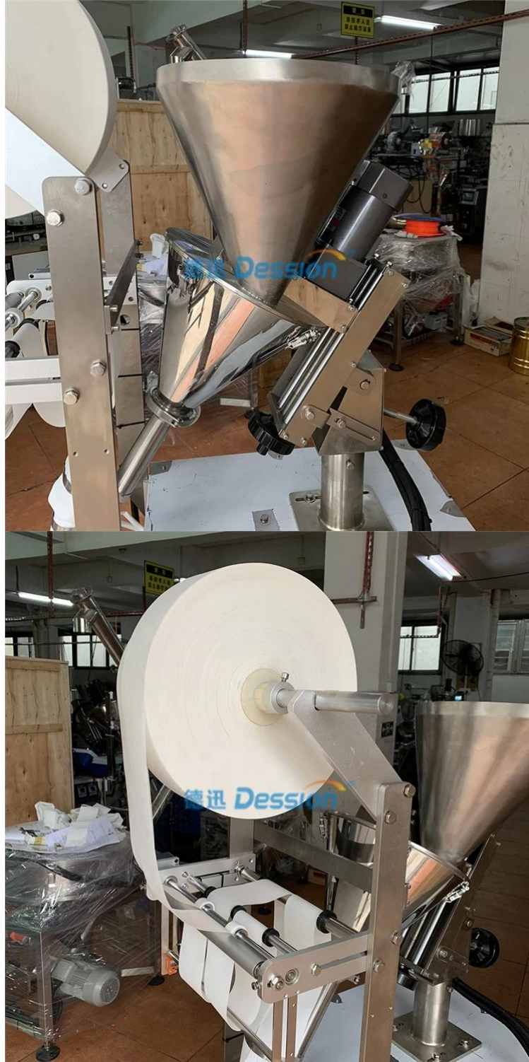
تحضير الفيلم والحقيبة