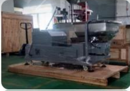
Wapping the Machine