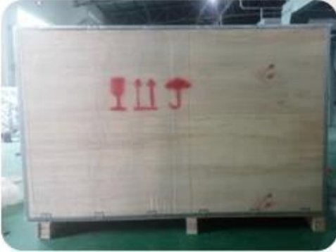
And Put into Wooden Case