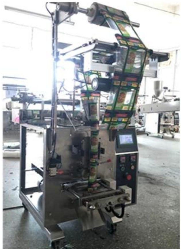
Full Stainless Steel 304, Food Grade Texture