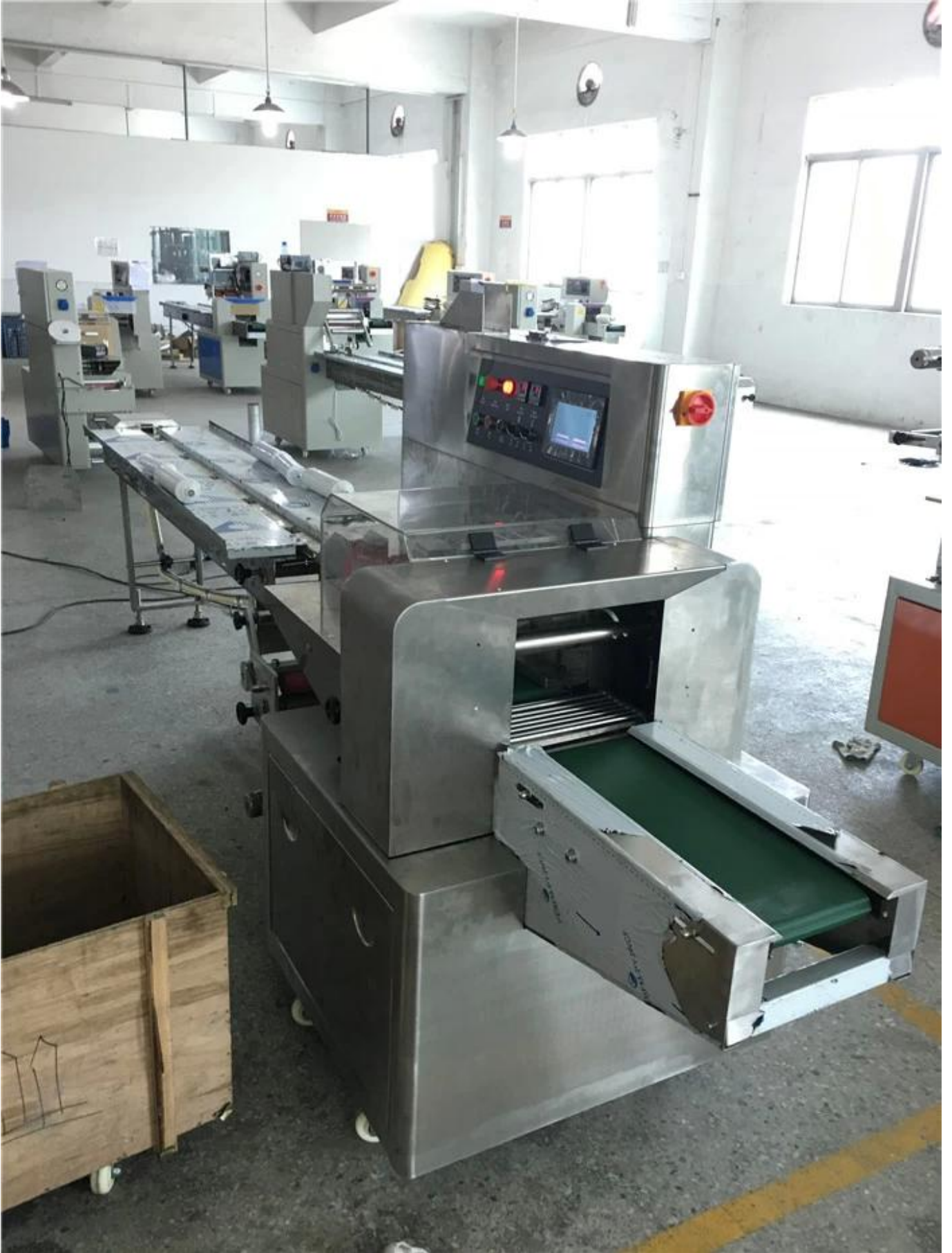
منظر أمامي جانبي