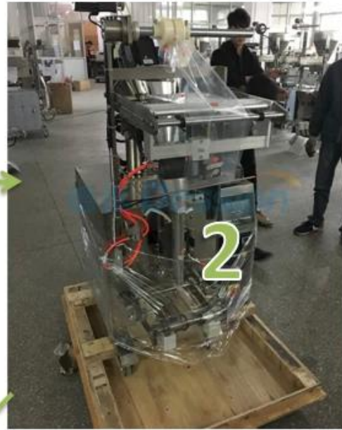
2. Wrapping the machine