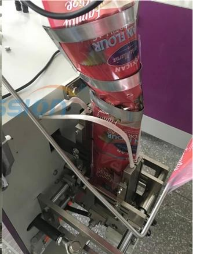
حقيبة تشكيل الجوانب