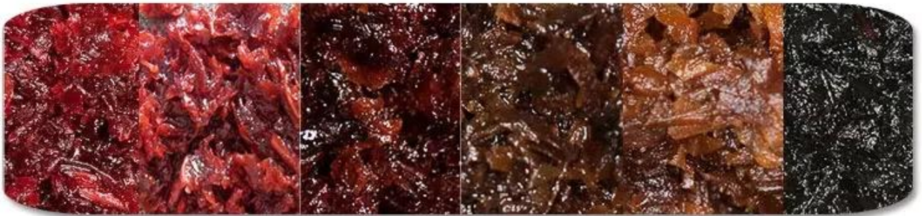
Shisha Tobacco Materail

Dession Shisha-Tabak-Verpackungsmaschine a Anwendbar für Sticks wie Shisha, Tabak, Wasserpfeife usw.