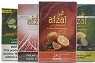
Cellophane & Tear Line Wrap