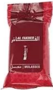
Plastic Bag Packing