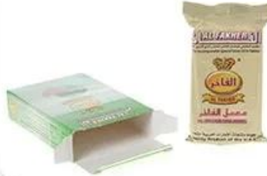
Bag Into Box