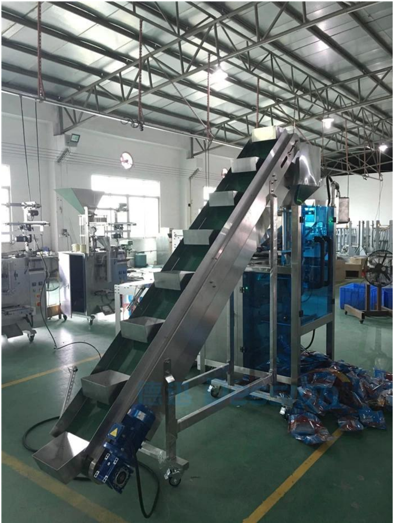
Packstück 1 kommt rein