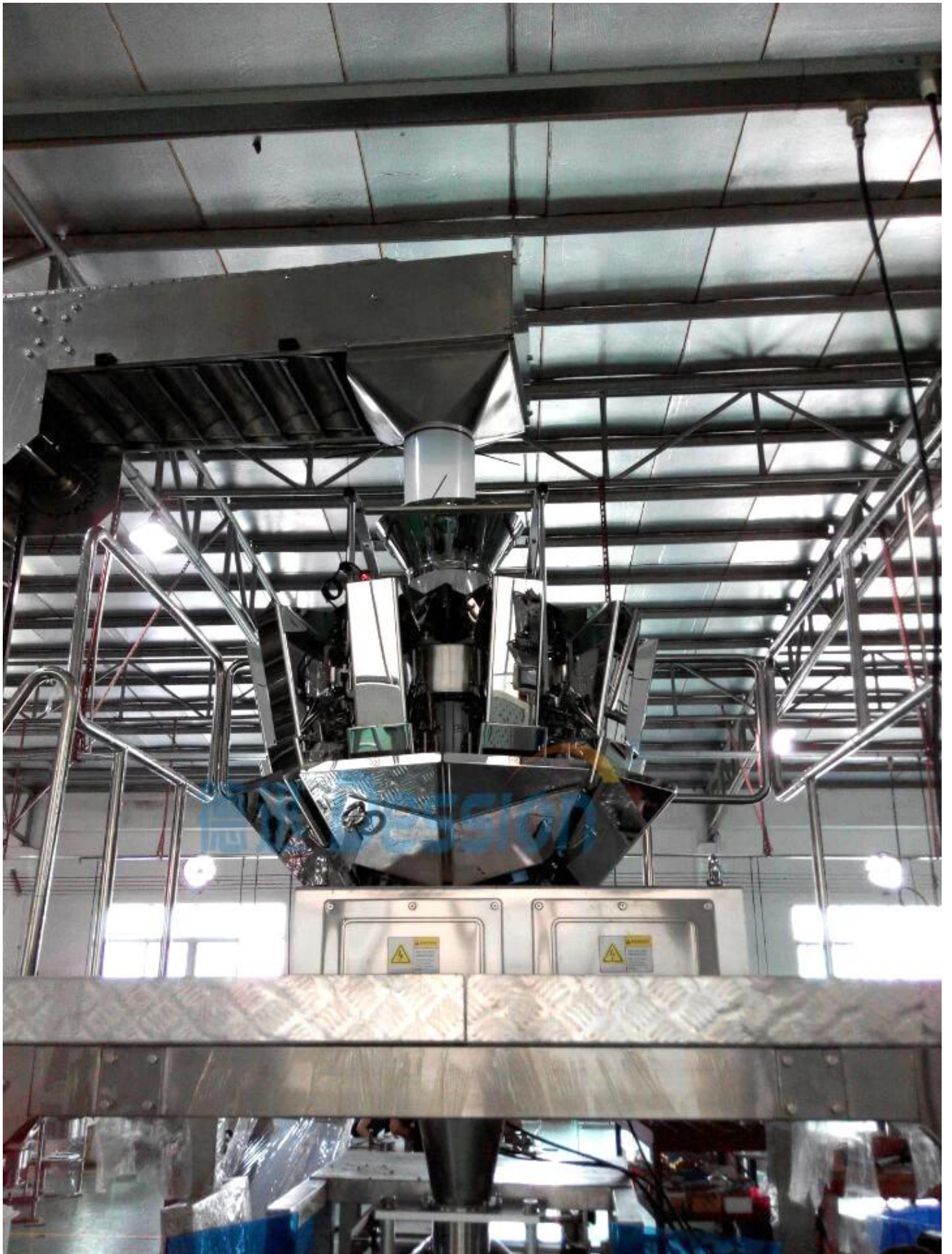
Wiegen mehrerer Köpfe