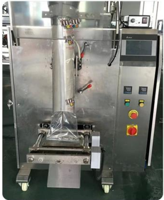
Bag sealing and touch screen