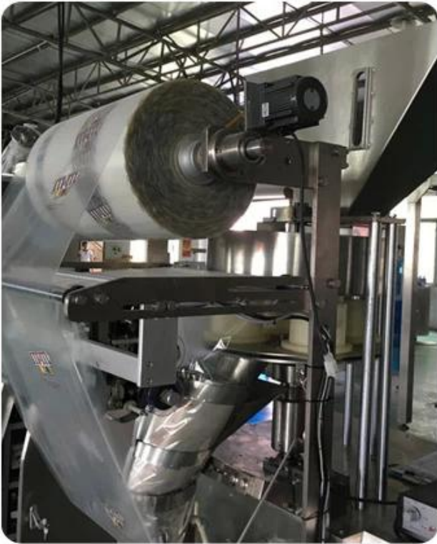
Roll of film for bags