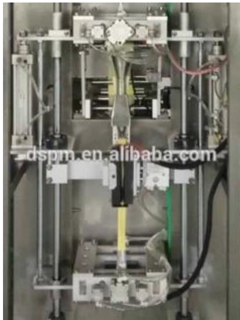
Außenbeutel Form Stück, Abdichtung und schneiden