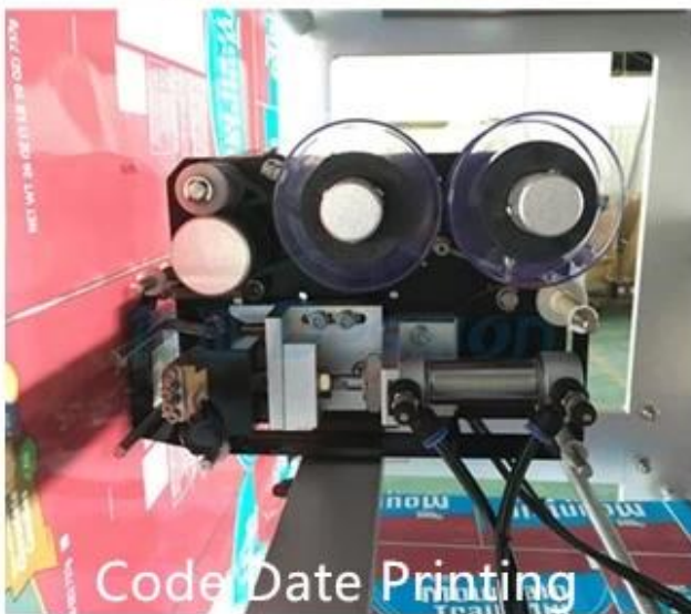
Code Date Printing