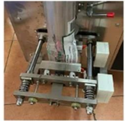
Bag Cutting Device