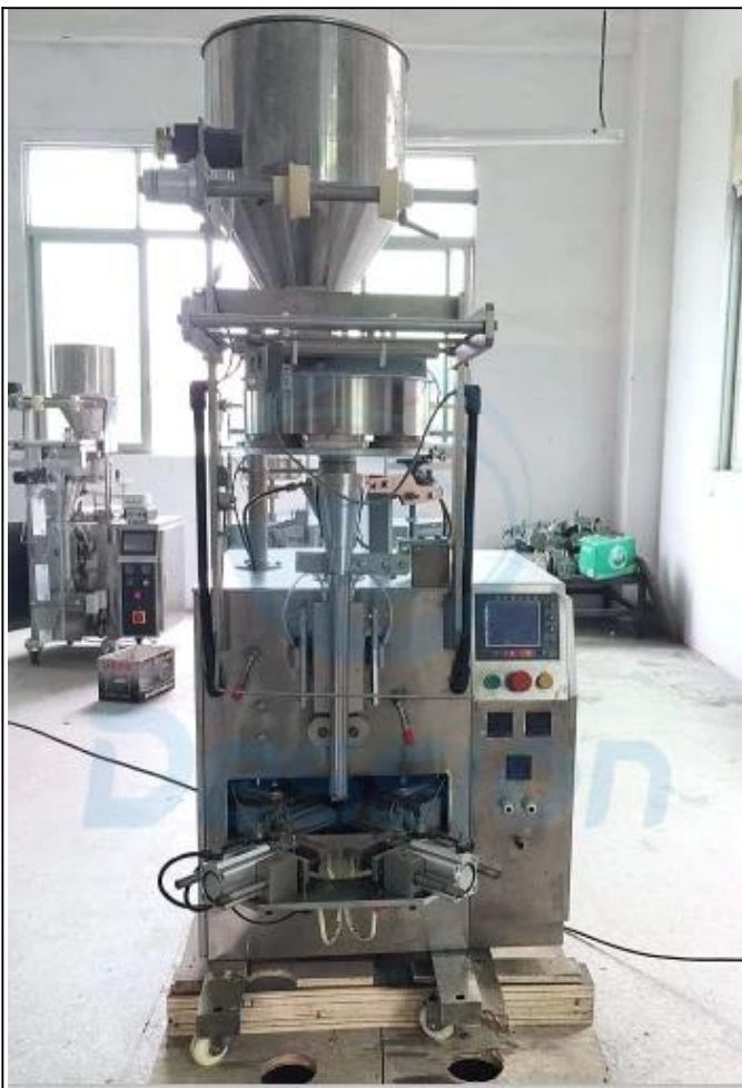
VORDERSEITE DER MASCHINE