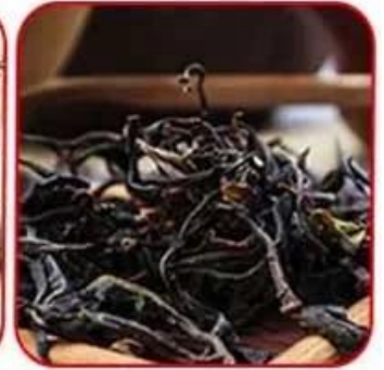
Ceylon black tea