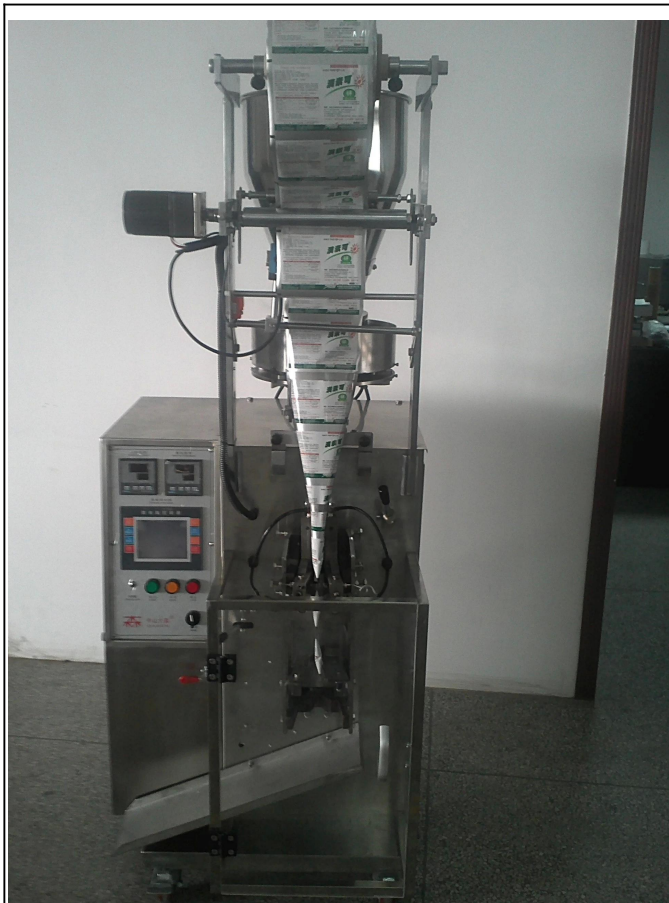
VORDERSEITE DER MASCHINE