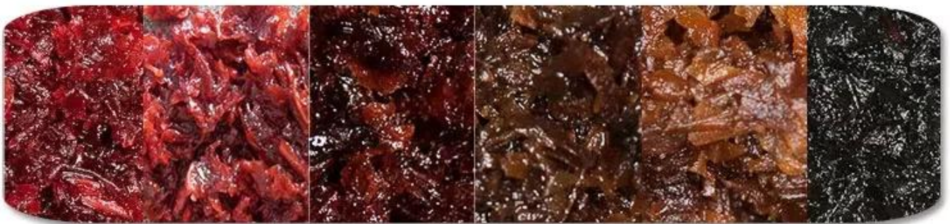
Shisha Tobacco Materail

Dession Shisha-Tabak-Verpackungsmaschine a Anwendbar für Sticks wie Shisha, Tabak, Wasserpfeife usw.