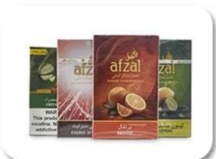
Cellophane & Tear Line Wrap