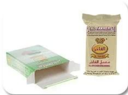
Bag Into Box