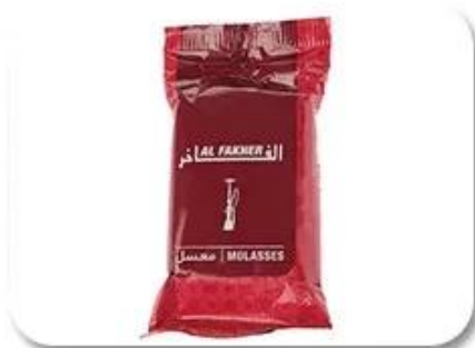
Plastic Bag Packing