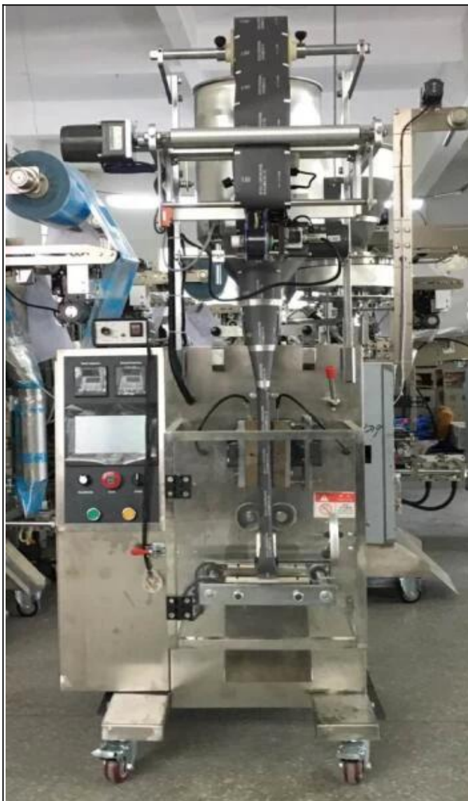
VORDERSEITE DER MASCHINE