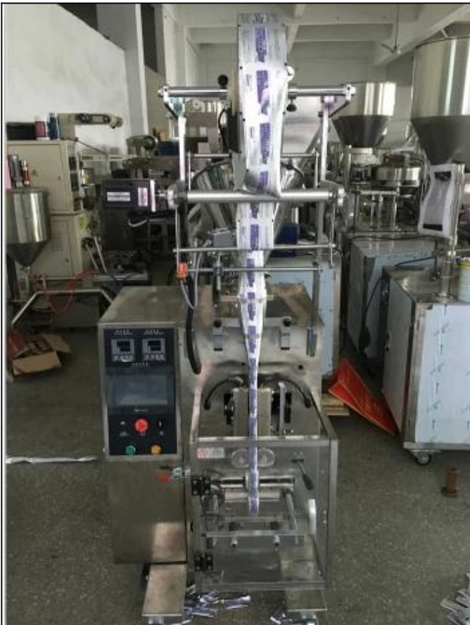
VORDERSEITE DER MASCHINE