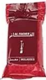
Plastic Bag Packing