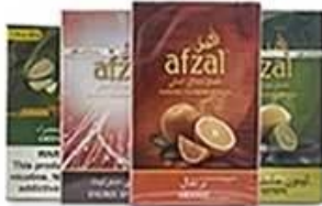
Cellophane & Tear Line Wrap