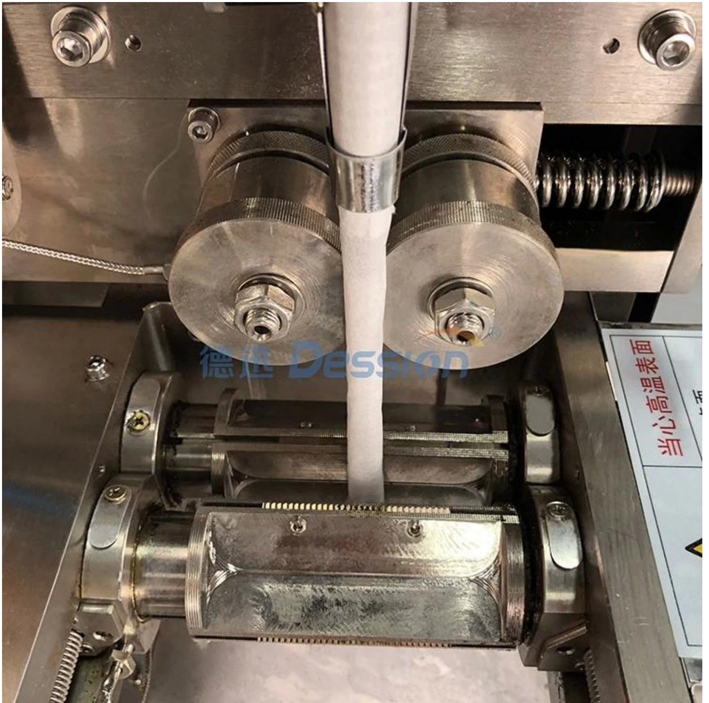
Vorrichtung zum Verschließen und Schneiden von Beuteln