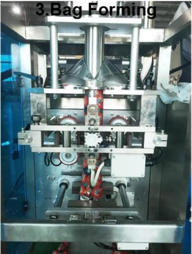
3. Bag Forming