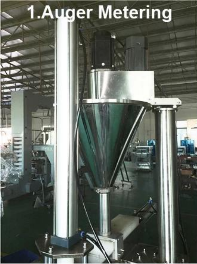
1. Auger Metering