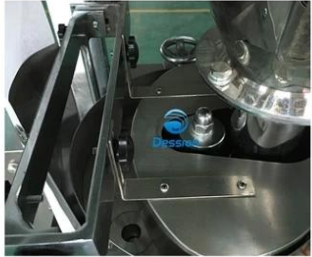
2.Cup Mearing to make the assign grams