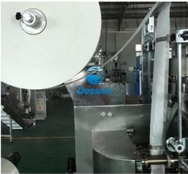
3.Inner Tea Bag Making