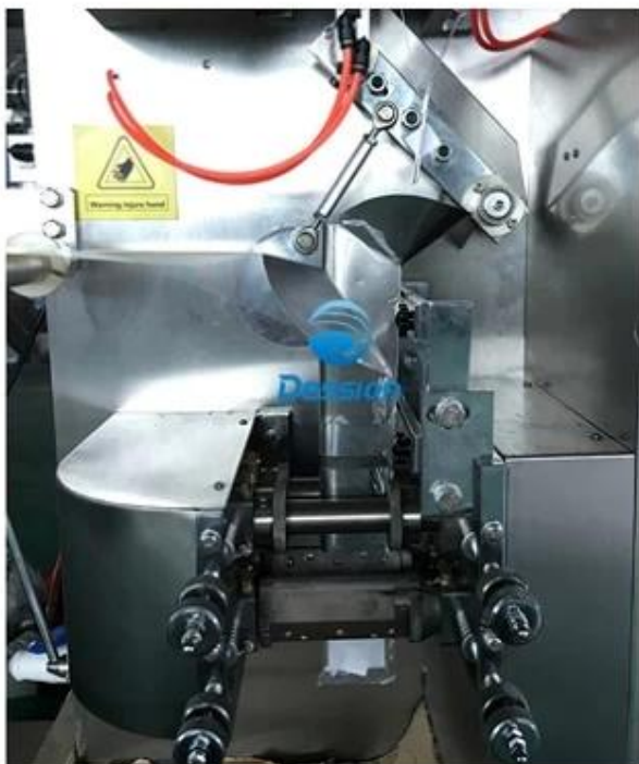
5.Outer Bag Making