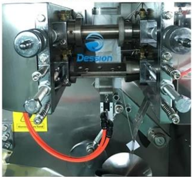
4.Put finished inner bag into device