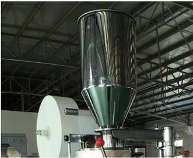
1.Put material into the Cup