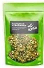
Stand up pouch bag