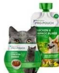
Special shaped bag