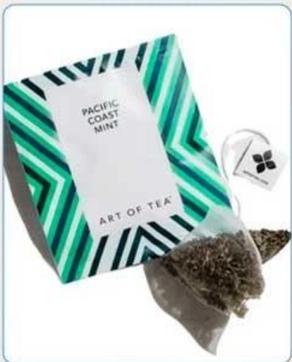
Tea Bag With Envelop