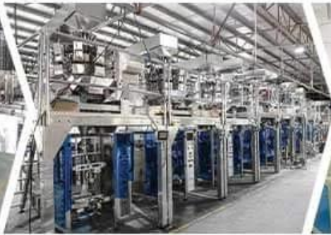
LARGE VERTICAL WORKSHOP