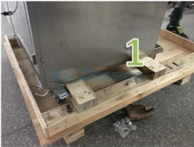
1. Put the machine on the carton