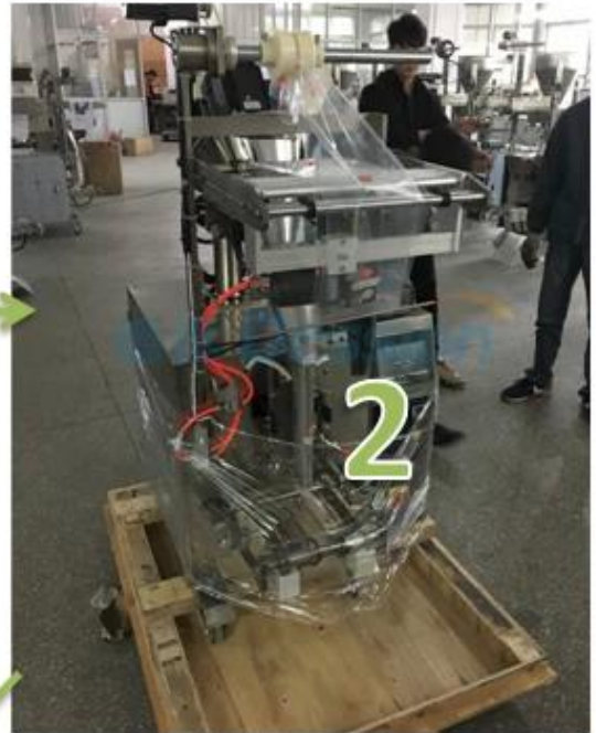
2. Wrapping the machine