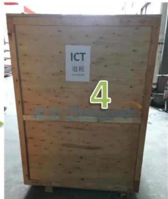
4. Waiting for shipping

Preis der Verpackungsmaschine für Snusbeutel