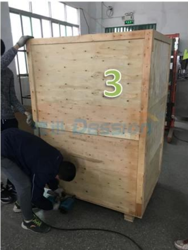
3. Sealing the carton