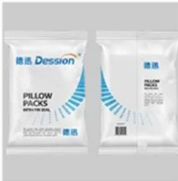
Back Seal Bag