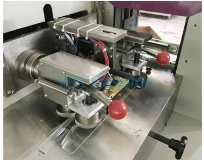
Großsieb- und Beutelformung