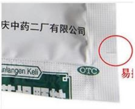
Easy Tearable device