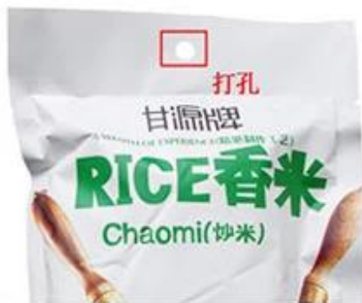
Round Punching Hole