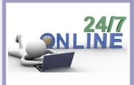
7-24 Hours services