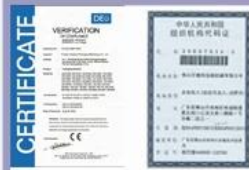
Tight quality control