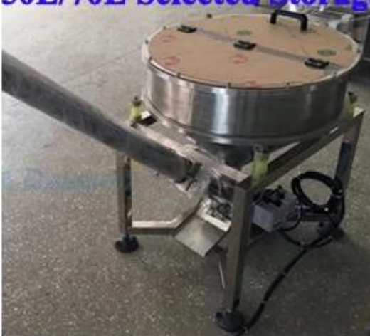
Vertical Screw for non-flow powder