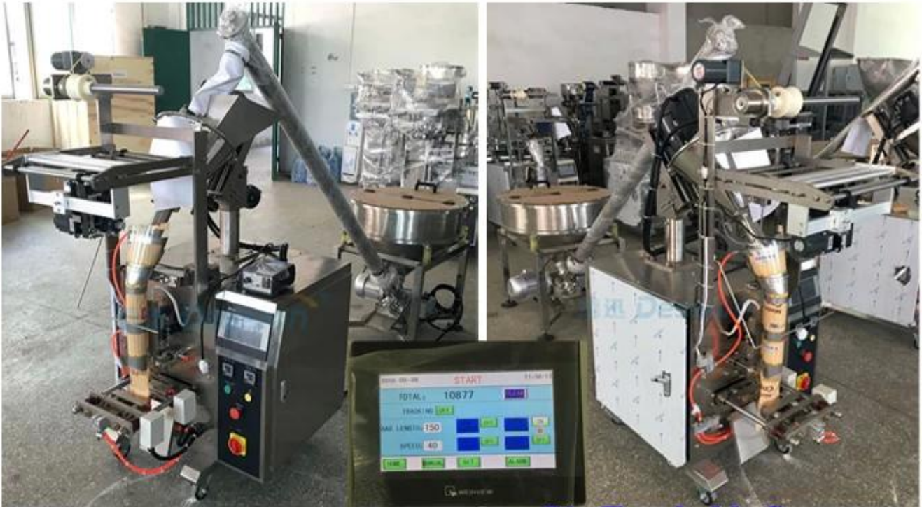
Big Touchable Screen

Super berührender Bildschirm, Kundenspezifischer 50L/70L Vorratstrichter, Schraube Messgerät