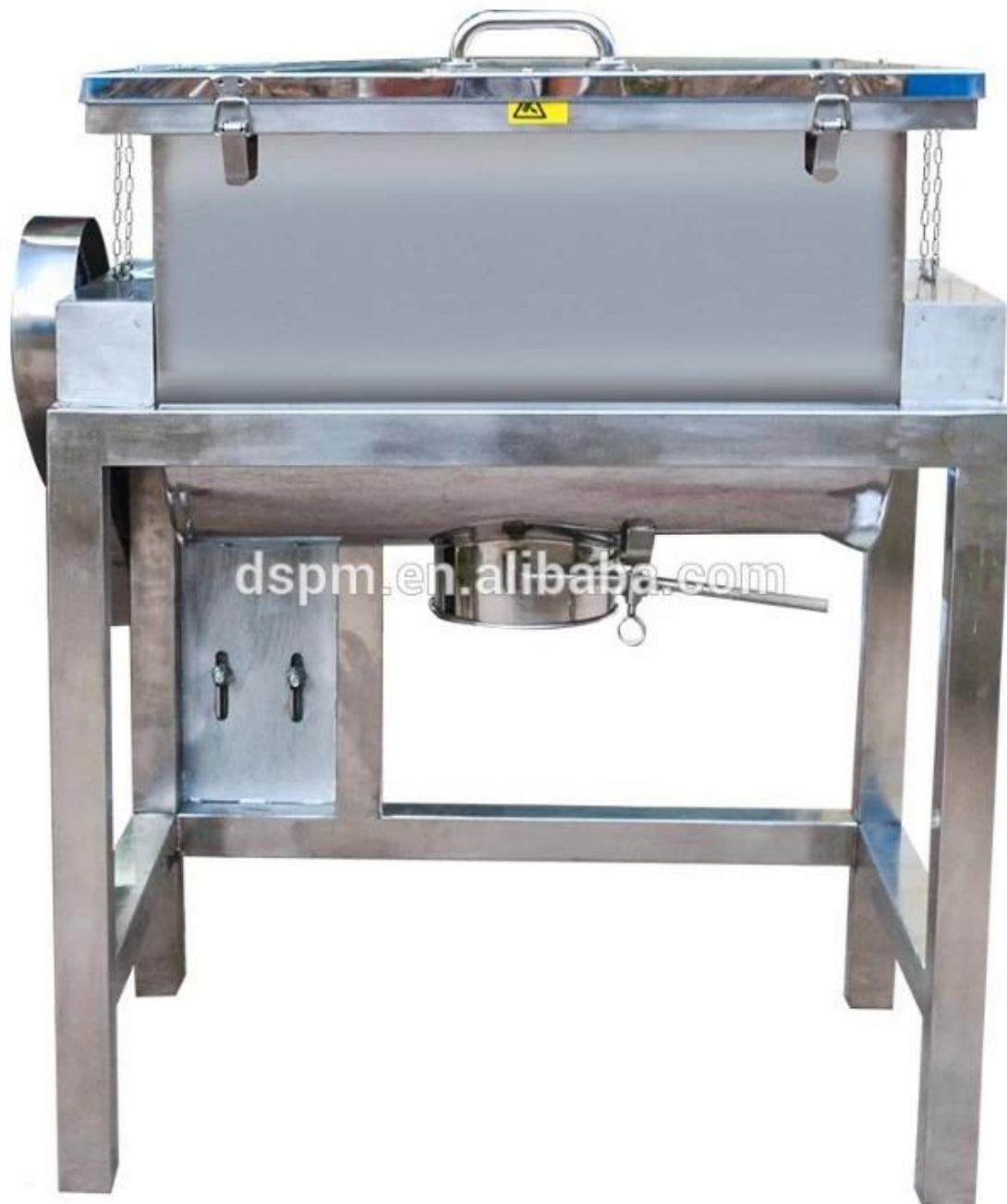
Mezclador en forma de W