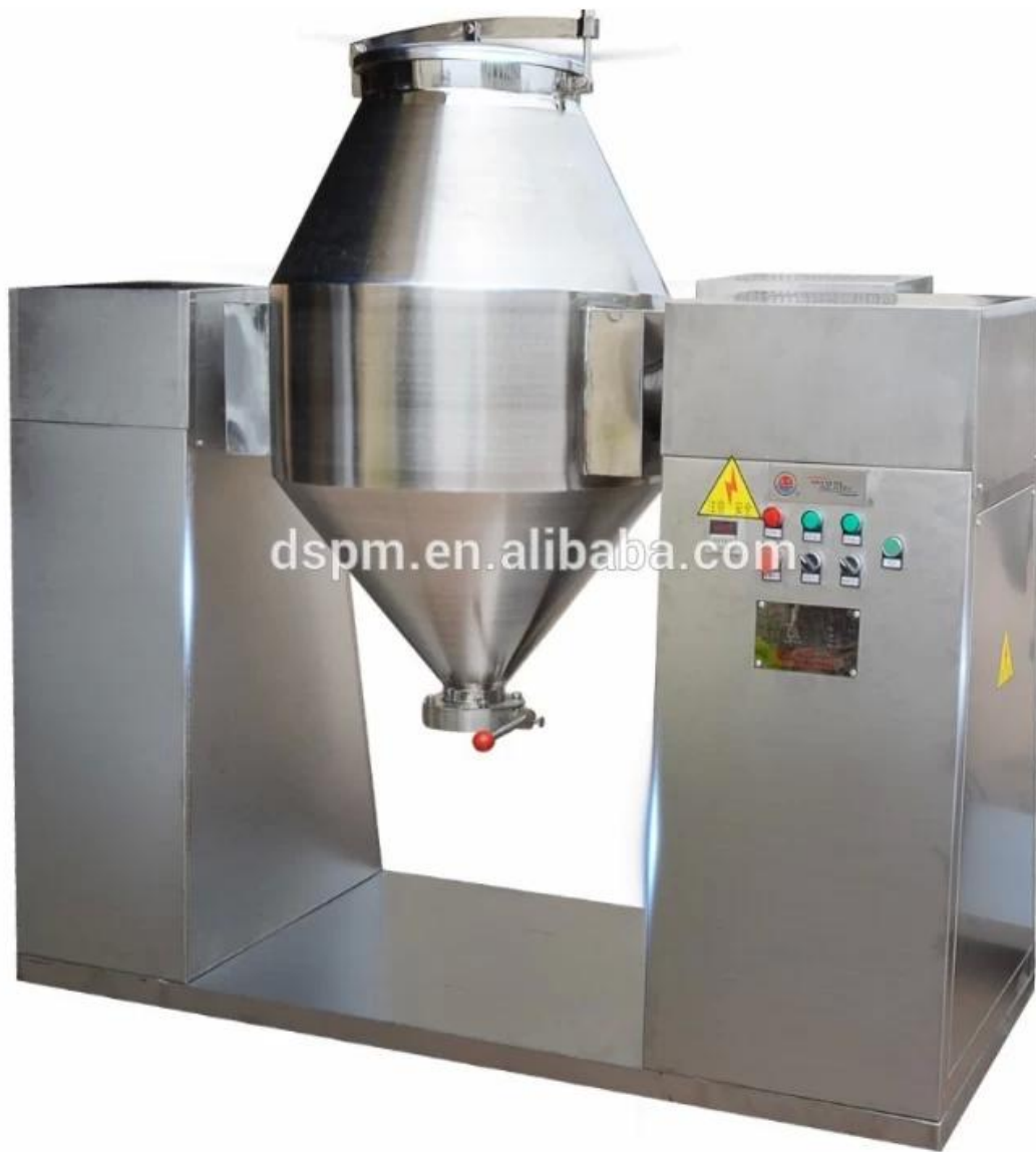
Mezclador en forma de V