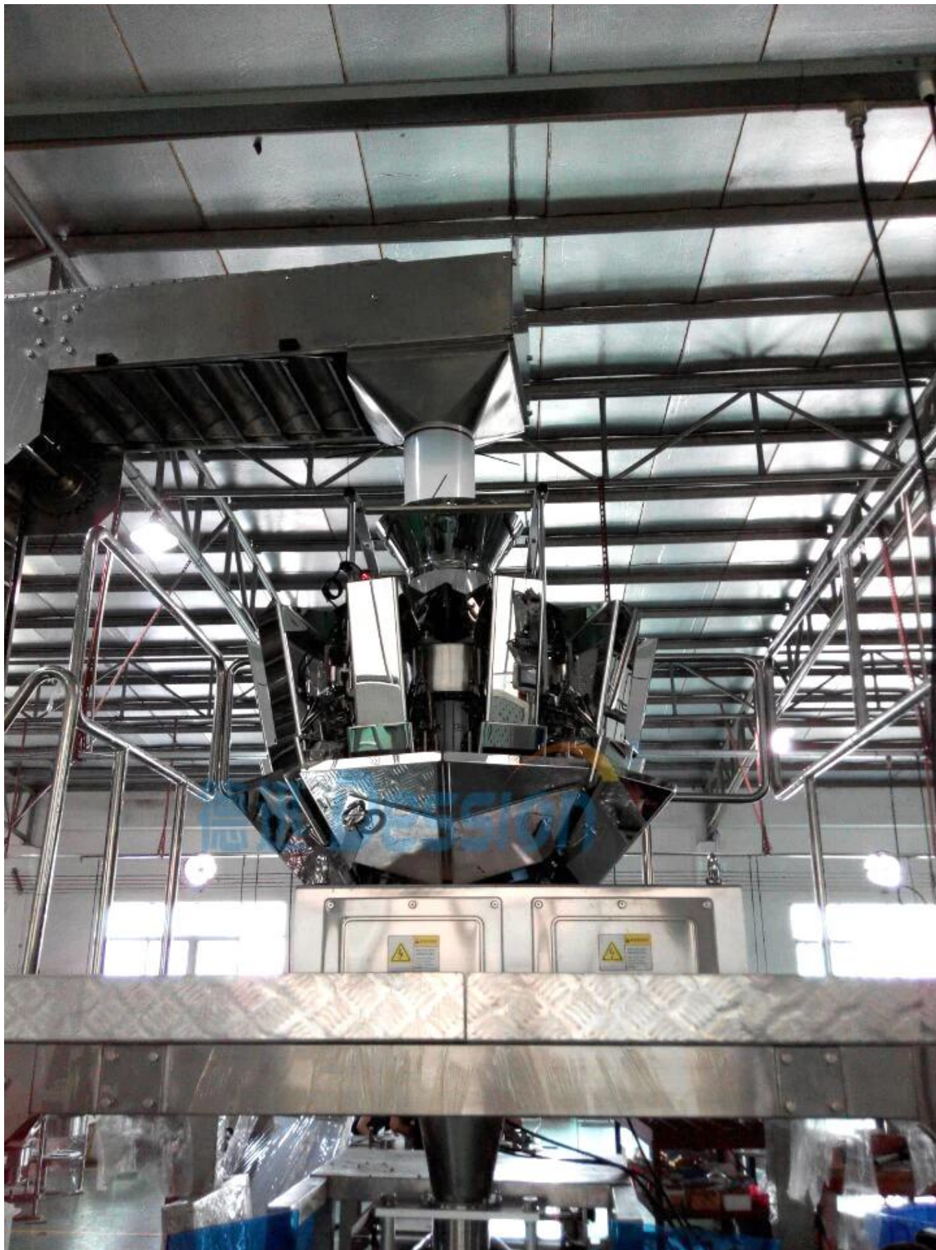
Pesaje de cabezas múltiples