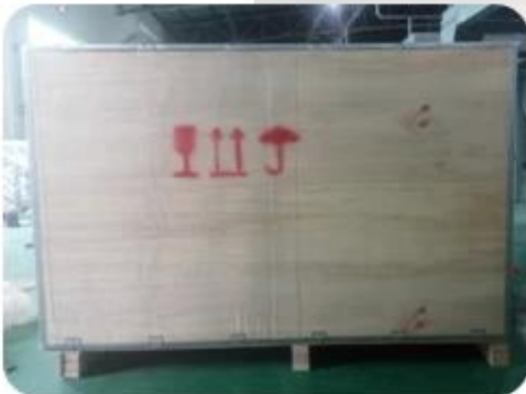
And Put into Wooden Case