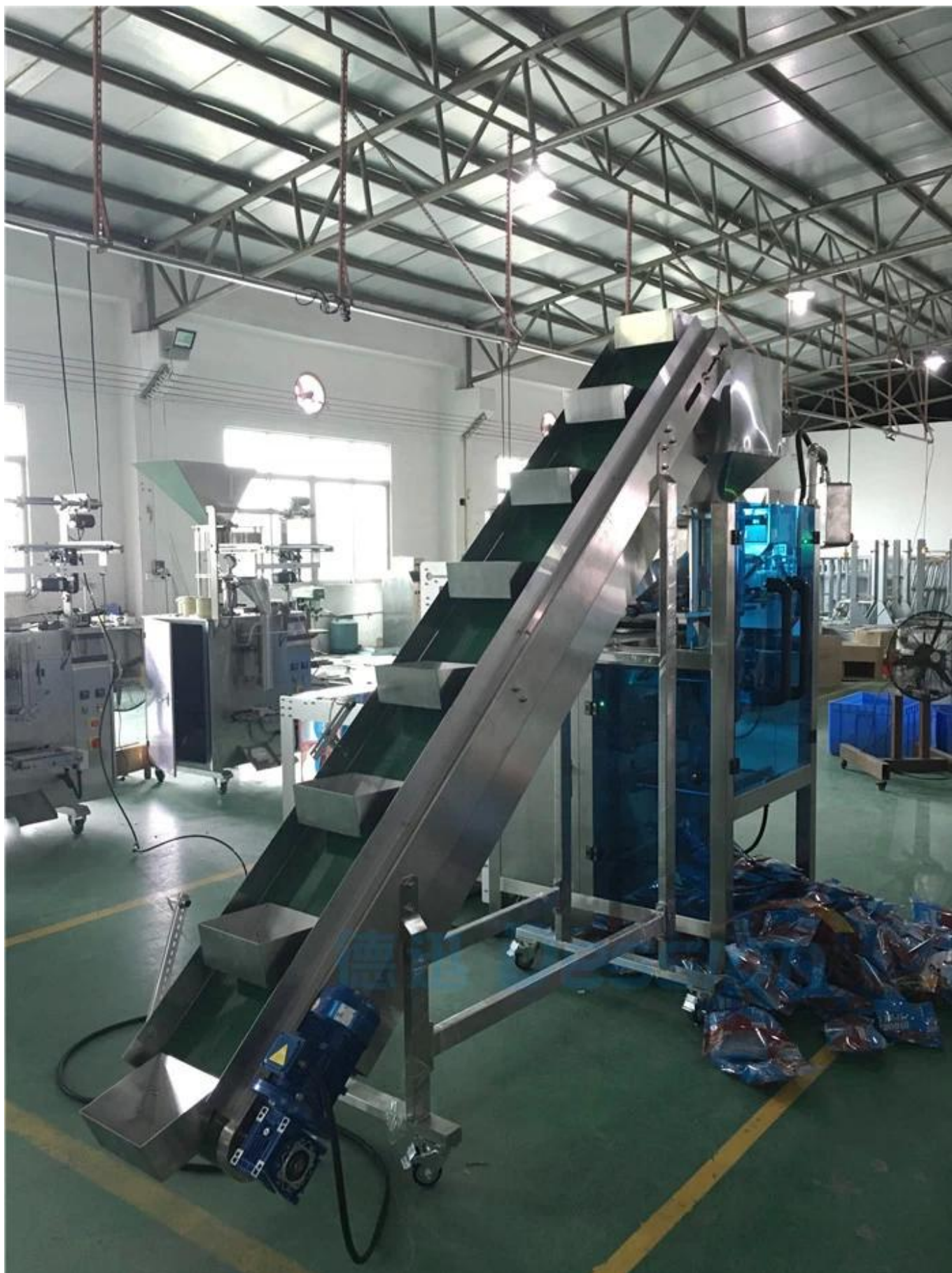
El artículo embalado 1 entra