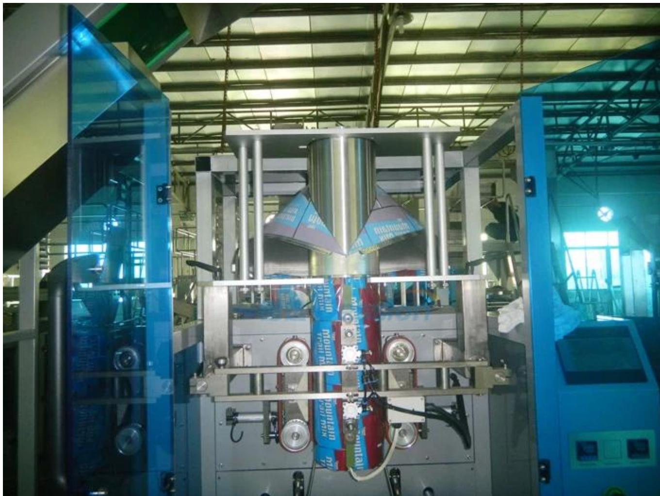
Formación de bolsas