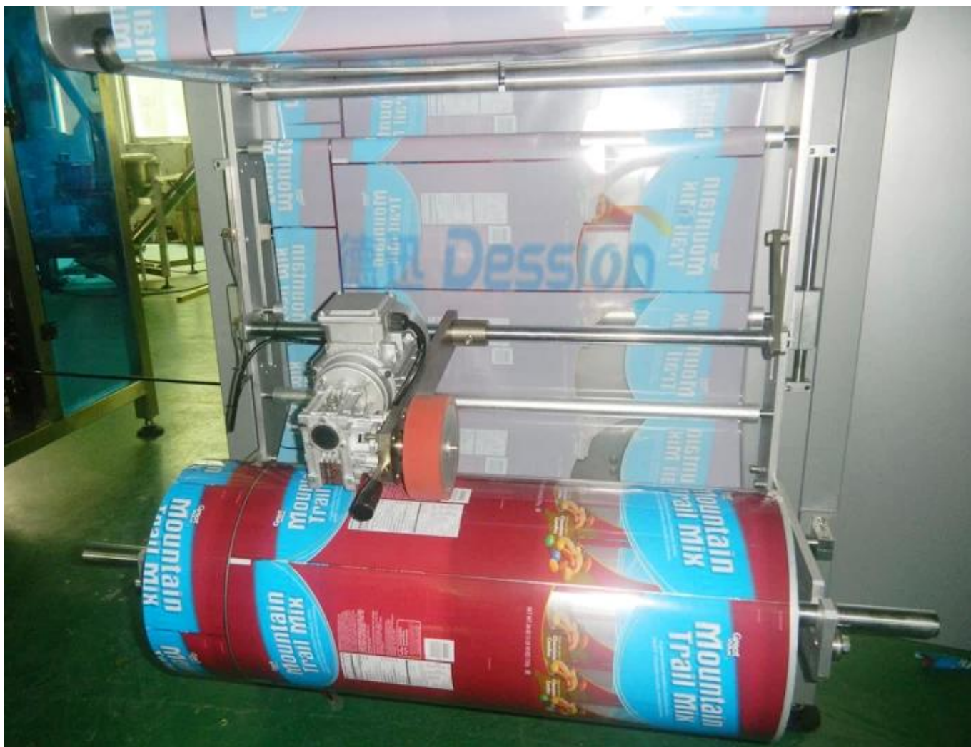
Tirando de la película