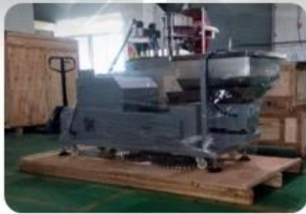
Wapping the Machine